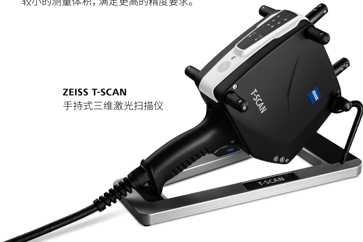
ZEISS T-SCAN 手持式三维激光扫描仪

手持式激光扫描仪可同时与接触式探针，以及另外两款光学跟踪系统搭配使用。蔡司 T-TRACK 20 作为一套技术成熟的系统，最大可覆盖 20 m 3 的测量体积，全新蔡司 T-TRACK 10 则适用于较小的测量体积，满足更高的精度要求。