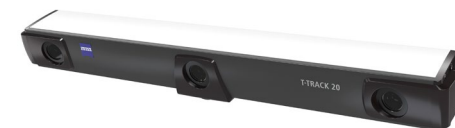
ZEISS T-TRACK 20 光学跟踪器，覆盖 20 m 3 测量体积