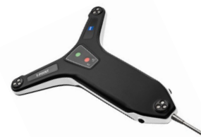
ZEISS T-POINT 手持式接触探针，用于单点测量